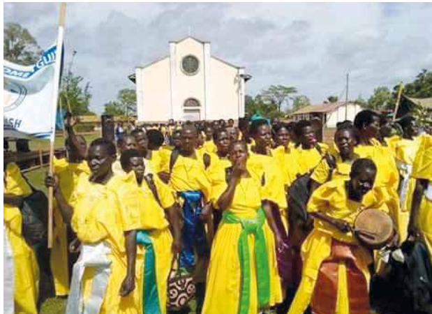
Uganda. Parrocchia di Alenga. Fedeli in festa

Traendo ispirazione dal brano evangelico ( Gv 4 – Gesù e la donna di Sa-