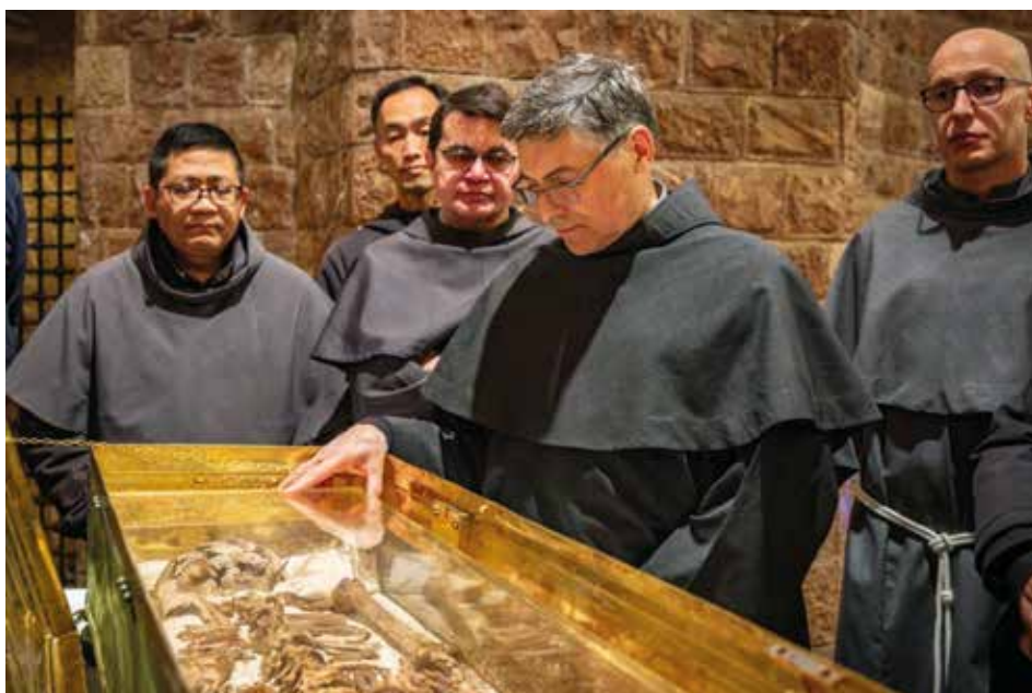
Assisi. I frati venerano i resti delle spoglie di san Francesco