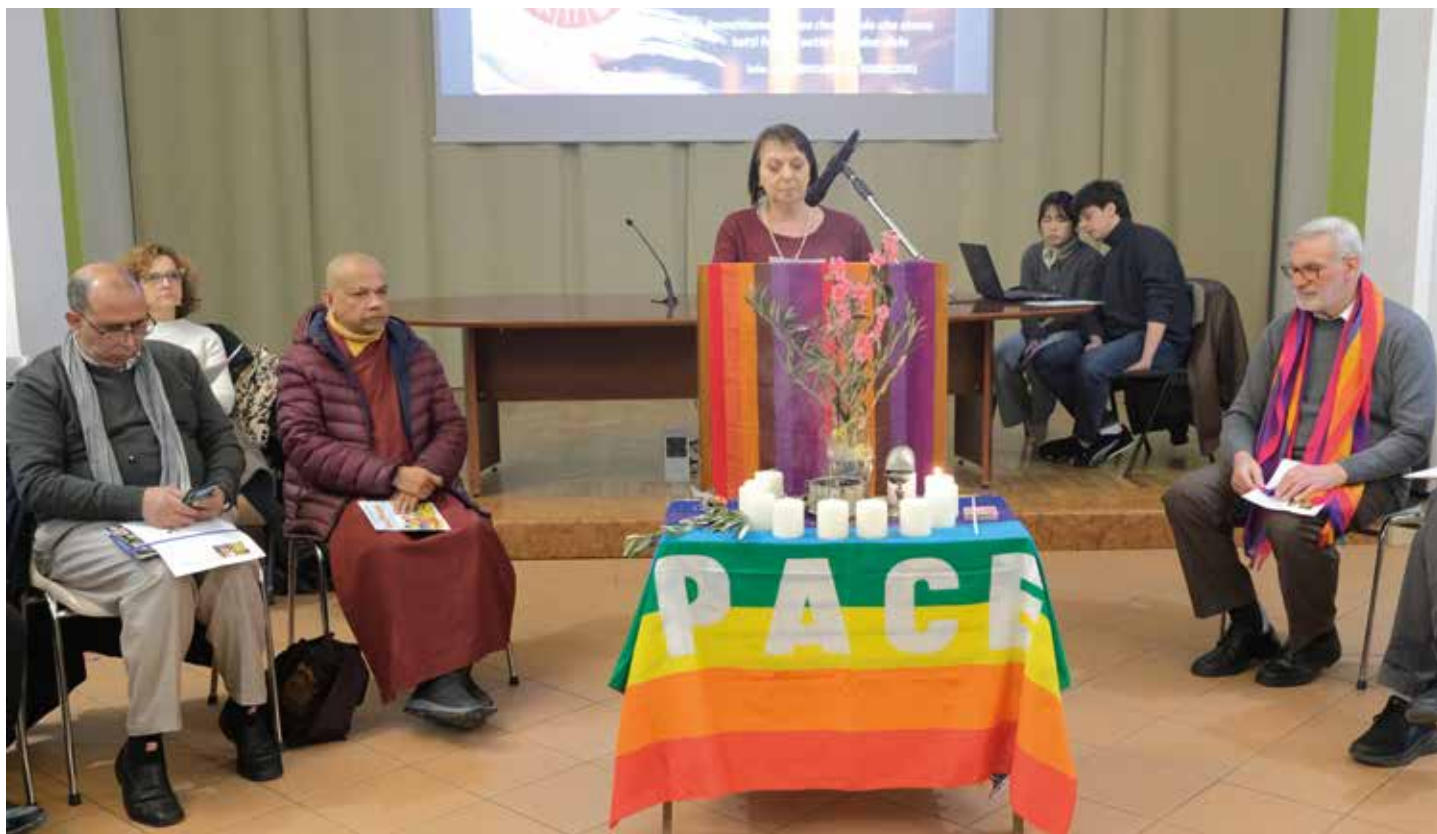
Preghiera interreligiosa per la pace