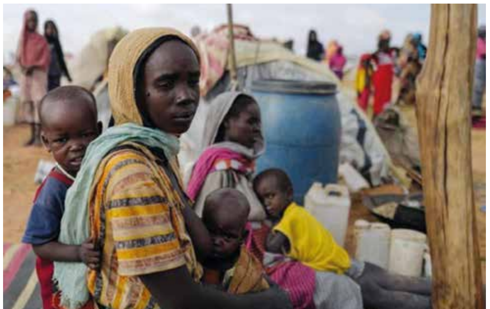
Profughi sudanesi nel vicino Ciad