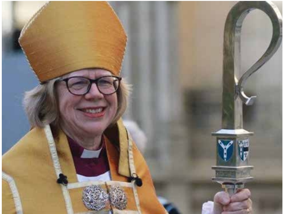
La nuova arcivescova di Canterbury, Sarah Mullally. La prima nella storia della Chiesa anglicana