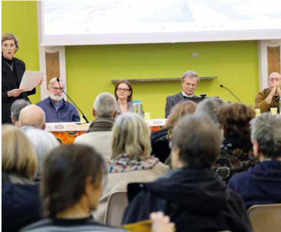
Padova. Incontro su "Il cibo e del suo spreco" nella casa dei comboniani

Venerdì 6 febbraio si è svolta a Padova, presso la casa dei missionari comboniani, la prima serata del nuovo percorso Nel solco della Laudato si' , dal titolo Accogliere i limiti