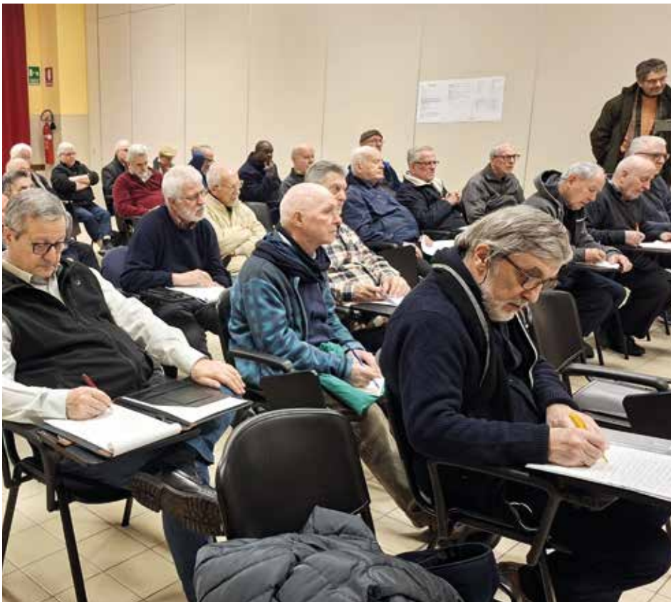
Partecipanti all'Assemblea della missione

Un tempo è stato dato all'ascolto dei rappresentanti dei Laici missionari comboniani (Lmc) , una decina di gruppi in Italia. Stanno seguendo un percorso per farsi riconoscere dalla Chiesa come associazione di fedeli. (Il riconoscimento di un gruppo di fedeli da parte del Vaticano è un processo canonico che formalizza